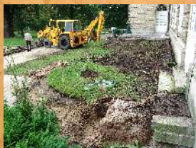
Remont tarasu północnego. 2005 r.