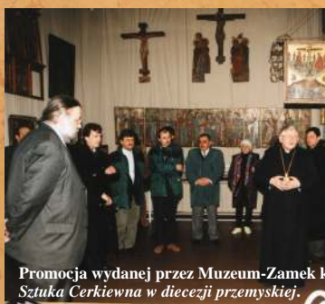
Promocja wydanej przez Muzeum-Zamek książki, Sztuka Cerkiewna w diecezji przemyskiej .