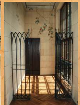
Konserwacja wnętrza Zameczku Romantycznego. 1998 r.