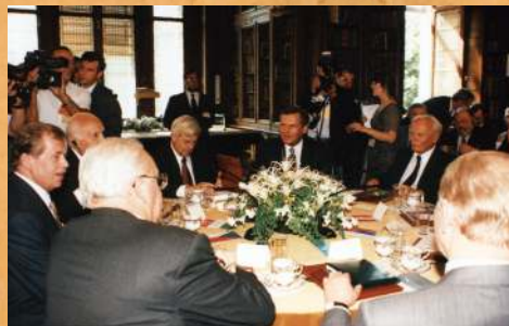
Spotkanie Prezydentów 9 państw Europy Środkowej. 1996 r.