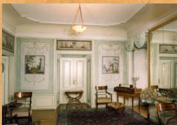
Apartament Brenny po konserwacji. 1997 r.