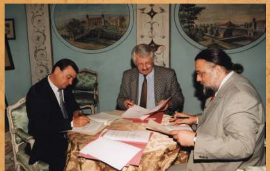
Podpisanie porozumienia o współpracy, pomiędzy Parkiem Dendrologicznym Zosiówka, Ośrodkiem Ochrony Zabytkowego Krajobrazu i Muzeum-Zamkiem w Łańcutcie. 1999 r.