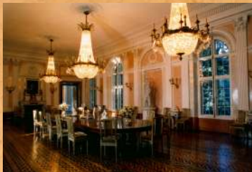
Konserwacja Wielkiej Jadalni. 1996 r.