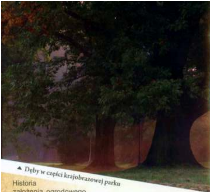
▲ Dęby w części krajobrazowej parku

Historia założenia ogrodowego przy Zamku w Łańcucie sięga przełomu XVIII i XIX wieku. Z tego okresu przetrwało do dziś wiele drzew, stanowiąc ozdobę parku, w tym lipy, buki, platany, miłorząb i wiele innych. Ale najbardziej znaczące przemiany w parku nastąpiły na przełomie XIX i XX wieku, kiedy właścicielami Łańcuta byli Roman i Elżbieta Potoccy. Całkowicie został zmieniony układ kompozycyjny ogrodu w bezpośrednim sąsiedztwie Zamku, powstał, bardzo modny na ówczesne czasy, ogród różany ozdobiony wieloma marmurowymi wazami i rzezbami. Tuż obok założono rabatę bylinową w formie wstęgi, a od strony wschodniej Albert Pio zaprojektował ogród włoski mający postać wgłębnika z dwoma wodotryskami. W tym czasie powiększono park prawie dwukrotnie dołączając duży teren od strony wschodniej. W chwili obecnej wszelkie prace w parku zmierzają do jak najbardziej wiernego odtworzenia układu kompozycyjnego i składu gatunkowego roślin z początku XX wieku, przy znaczącym wsparciu finansowym Narodowego Funduszu Ochrony Środowiska i Gospodarki Wodnej w Warszawie. Łączna kwota dofinansowania w ostatnim dziesięcioleciu wyniosła 1 524 557,28 zł.