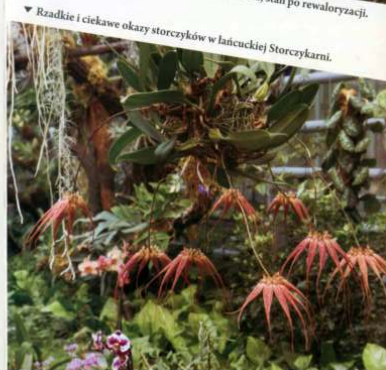
▼ Rzadkie i ciekawe okazy storczyków w łańcuckiej Storczykarni.