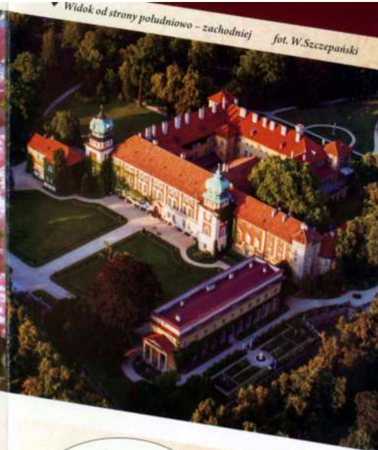
▼ Widok od strony południowo – zachodniej