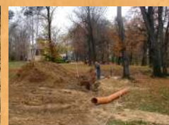
Remont instalacji kanalizacyjnej Zameczku romantycznego. 2004 r.