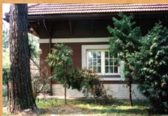
Zakończono remont budynku gospodarczego Storczykarni - ciepłowni gazowej. 2001 r.