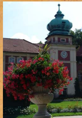
Wystawa projektów rewitalizacji zabytkowych budynków Muzeum - Zamku w Łańcucie, których realizacja ma podnieść atrakcyjność Zamku i Regionu. 2004 r.