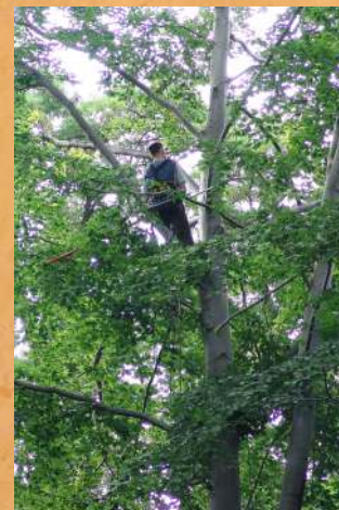
Bieca pielęgnacja drzewostanu parkowego.