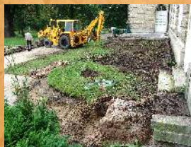
Remont tarasu północnego. 2005 r.