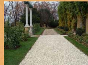
W 2004 roku zrekonstruowano nawierzchnię alejek parku wewnątrz trzono.