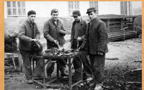
Przy ku ni polowej. 1959 r.