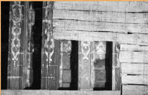
Odkrycie polichromowanego stropu z 1642 roku w czasie prac remontowych przeprowadzonych w 1958 r.