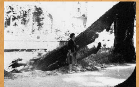
Skutki nawałnic przechodz ych nad miastem w latach 1959 i 1960.