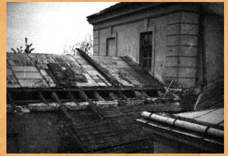
Remont dachu nad budynkiem Stajni w 1958 r.