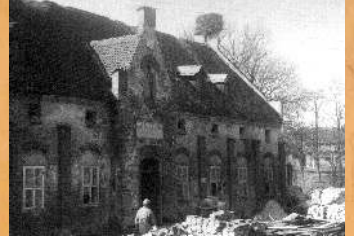
Remont Starej Likiernii. 1985 r.