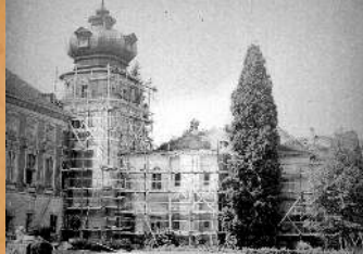
Remont wie y pn.-zach. i Biblioteki. 1972 r.