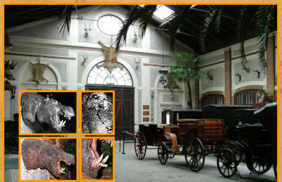
Prace remontowe w Powozowni i konserwacja trofeów my liwskich przeprowadzone zostały w latach 1988-1989.