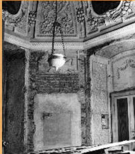
1977 r. Remont Sali pod Zodiakiem.