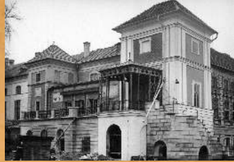
Odnowiona elewacja południowa. 1972 r.