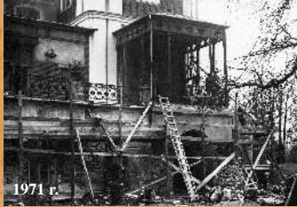
1971 r. Prace remontowe przy tarasie południowym.