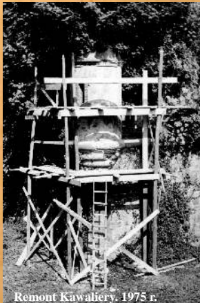
Remont Kawalery. 1975 r.