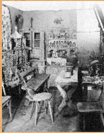
Zbiory regionalne. 1974 r.