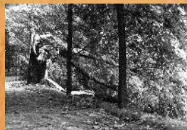
Zniszczenia w Parku spowodowane przez burz w 1988 roku.