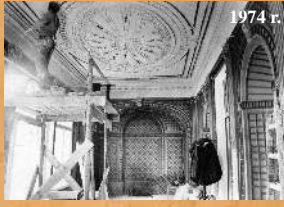
Konserwacja Pokoju Werandowego